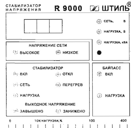
Рис. 1. Внешний вид передней панели стабилизатора

Шкала индикаторов "Ток нагрузки, %" показывает величину тока подключенной к стабилизатору нагрузки в процентах от допустимого значения.